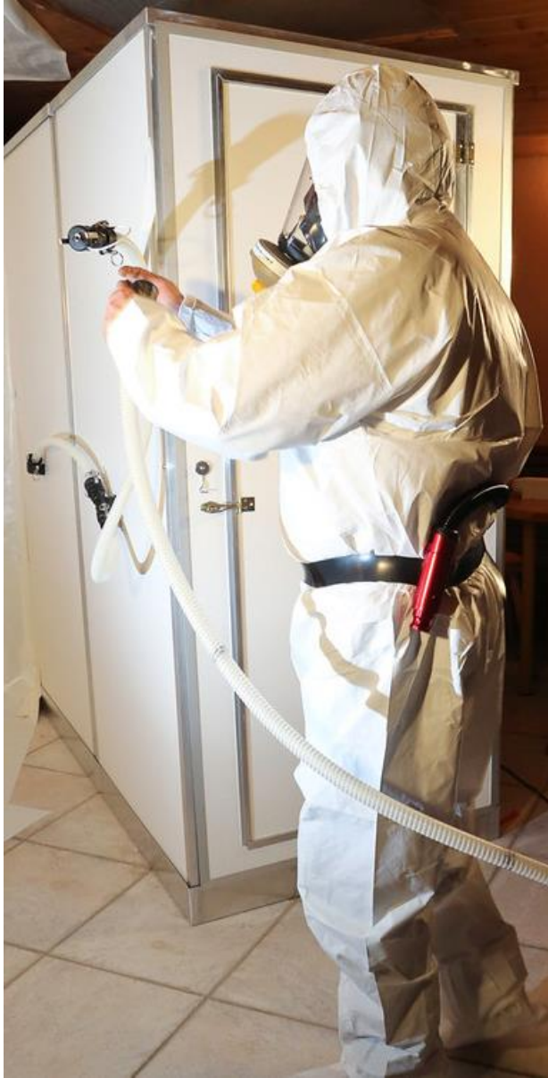
Enlever le bouchon et raccorder le tuyau de l'opérateur.