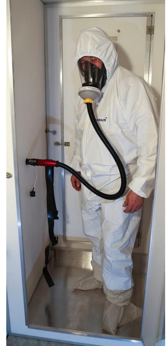
Répéter l'opération dans chaque SAS