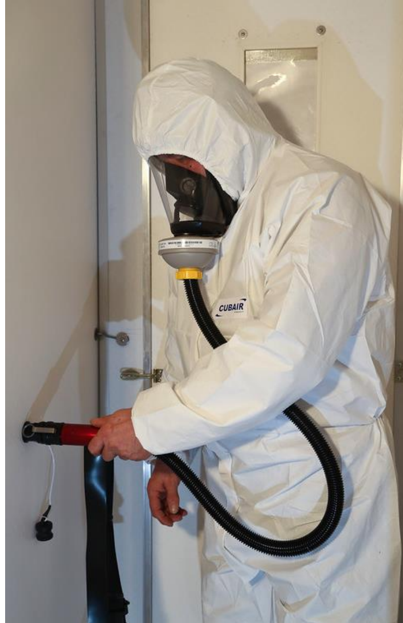
A l'intérieur du SAS se connecter au raccord d'air